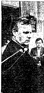
Интервью в перерыве

Мэр Санкт-Петербурга Анатолий СОБНАК в перерыве совещания 1 дня интервью Центральному телевидению и представителям других средств массовой информации. Анатолий Александрович за кратчайший период пребывания в Чебоксарах успел достичь соглашения с представителями Алашайского, Поречского и других районов Чувашии о взаимных поставках продукции.