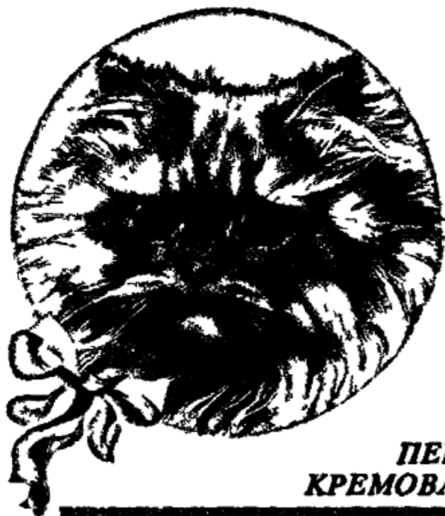
ПЕРСИДСКАЯ КРЕМОВАЯ КОШКА