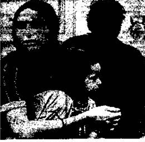
В каждой стране Юго-Восточной Европы есть свои экономические проблемы. Отличаются они только степенью остроты, степенью сложности, всегда втянутых с другими во живое сложными — экономическими, политическими, историческими, религиозными. Но все это — общие проблемы. А вот довольно конкретные проблемы — цыган, турок и русских.