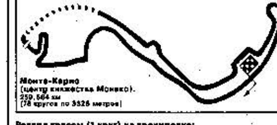
Монте-Карло (центр окрестностей Монако). 259,664 км (78 кругов по 3326 метров)

Сложнейшая городская трасса с туннелем и 360-градусными виражами, закрытыми к тому же от глупых гонимых высокими металлическими отбойниками, что плотную прилегают к трассе; перепады высот и практически полная невозможность обгона - вот лишь некоторые из опасностей, подстерегающих пилотов, тех, кто отваживается выходить на старт этих легендарных "гонок вокруг казино".