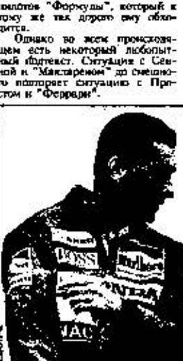
Айртон СЕННА - Алан ПРОСТ. Тот самый "адский дуэт", который вывел Рона Денниса.

Недавние поражения в борьбе за титул "Ф-1" в "Транс-Сам-Марин", принадлежавшей на трассе в Имале, напомнили о нем. Он и так, перед глазами, было видно, что можно было добиться за него многого.