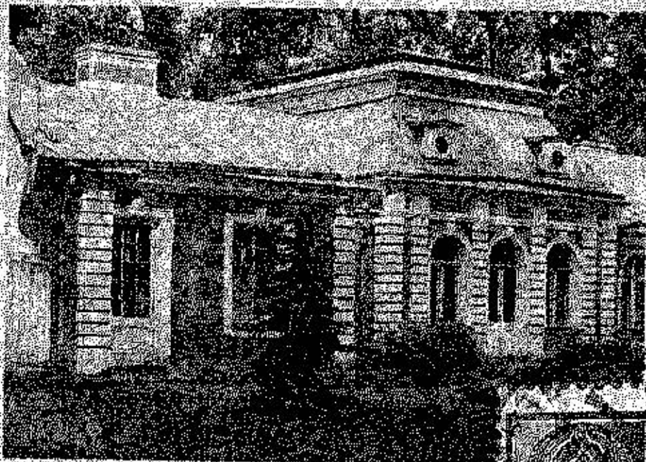
Петродворец. Дворец Монплеизр